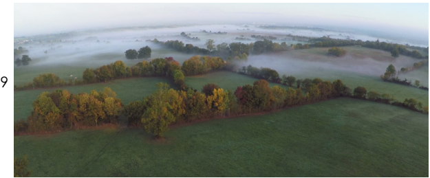
Maillage bocager de Bougon.