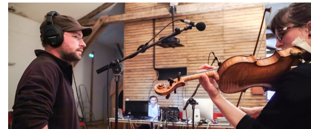
Enregistrement de la musique originale en studio.

https://www.facebook.com/lesfreres.braco